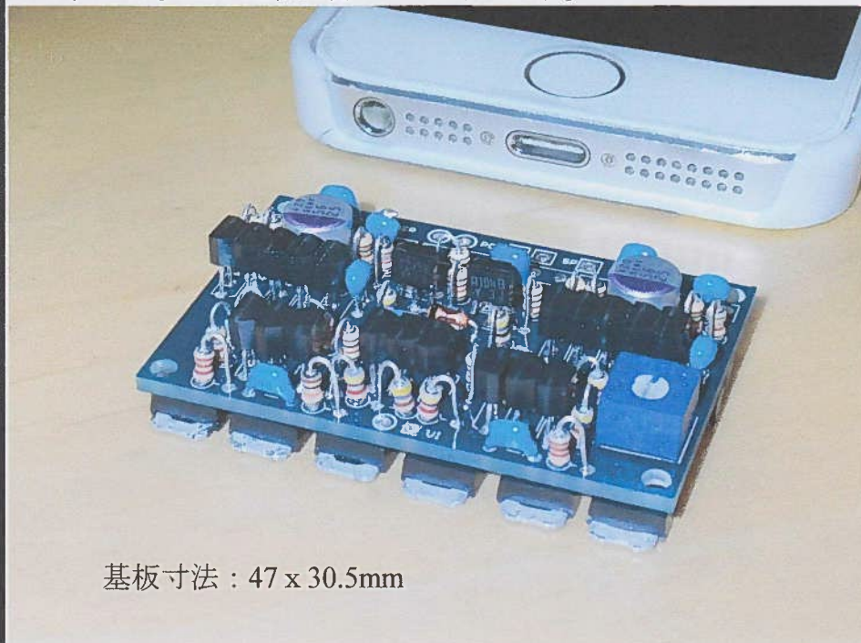
基板寸法：47 x 30.5mm

・アルミチャネル 25x50x50 を放熱器兼シャーシにしています。カバーケースはプラモデル工作のごとく、樹脂板で自作加工しました。基板をいくら小型にしても、バッテリーの大きさ、コネクタ等の機構部品が寸法の限界を決めてしまいますので、これ以上小型化は難しいと考えます。